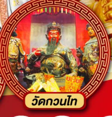
วัดกวนไท