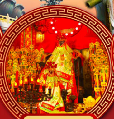
วัดเจ้าแม่กวนอิม ฮ่องกง