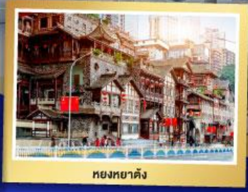
หยงหยาดัง