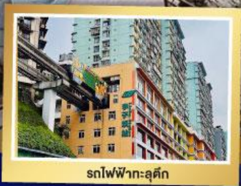
รถไฟฟ้า-ลู่ตัก