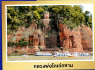
หลวงพ่อโตเล่อซาน