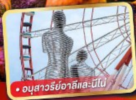
• อูซารียาอาลีและนิโ