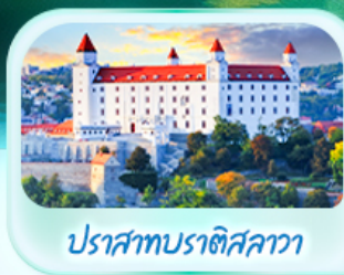
ปราสาทบราติสลาวา

เที่ยวชมเมืองฮัลส์สตุทท์ หมู่บ้านริมทะเลสาบสวยที่สุดในโลก พระราชวังเซินบรุนน์ เมืองลินซ์ จักรีสฮาพท์พลาซซ์ สัมผัสเมืองมรดกโลก เซสกี ครุมลอฟ เยี่ยมชมปราสาทปราก ถนนทองคำ เข็คอินสถานที่ชื่อดัง! ปราสาทบราติสลาวา ส่องเรือชมความงามแม่น้ำดานูบ แม่น้ำที่ยาวที่สุดในยุโรป ชมความน่าหลงใหลของ ปราสาทบูดาเปสต์ สะพานชาร์ลส์