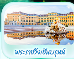
พระราชวังเซินบรุนน์