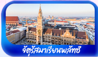
จัตุรัสมาเรียนพลัทซ์