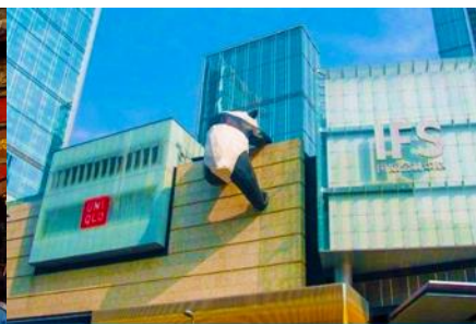
หมีแพนด้าปีนตึก ณ ตึก IFS