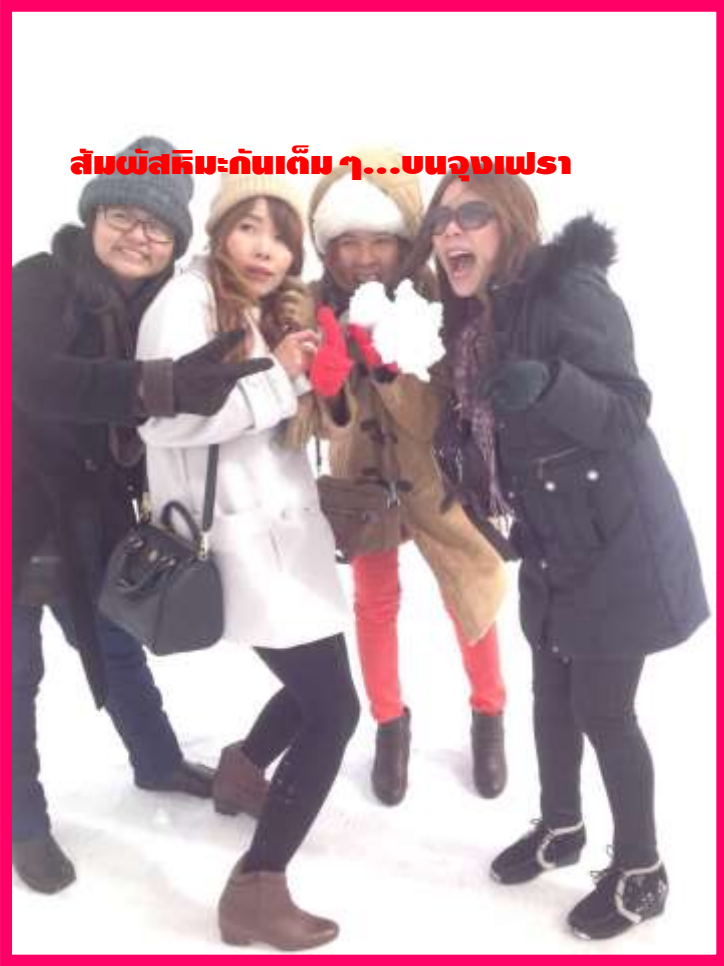
สัมผัสหิมะกันเต็ม ๆ...บน Jungfrau