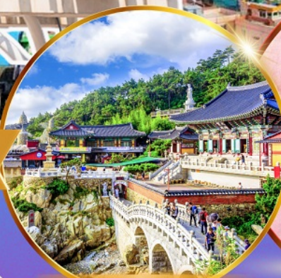
วัดแสดงยงกุงซา