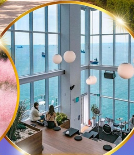
คาเฟ่วิวทะเล

ถ่ายรูปชิคๆ หมู่บ้านวัฒนธรรมคิมซอน ใหม่ล่าสุด คาเฟ่ริมทะเล วิวหลักล้าน ชมอุโมงค์ดินเมเปิ้ล สีส้มแดง ถ่ายรูปกับหลญาสีชมพู สดใส ขึ้นเคเบิลคาร์ ชมทะเลปูซาน ห้ามพลาด!! ตลาดปลาที่ใหญ่ที่สุด ชิมของอร่อยที่ตลาดแฮจุนแด อิสระช้อปปิ้ง Lotte Duty Free