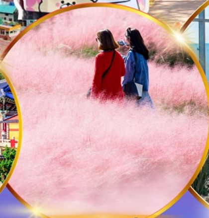
สวนสาธารณะแดโจ