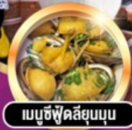
เมนูซีฟู้ดสุขภาพ