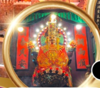
ขอพรซื้อขายอสังหาริมทรัพย์