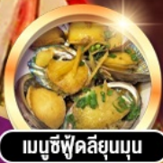
เมนูซีฟู้ดลิ้นจี่