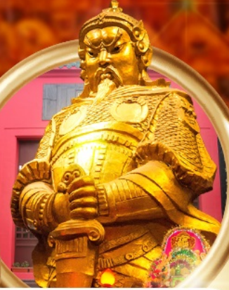
วัดเซ่งเจงฮิว