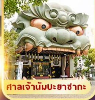
ศาลเจ้านัมมะยาซากะ