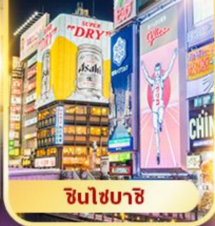
ชินไซบาชิ