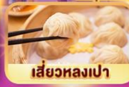
เสี่ยวหลงเป่า