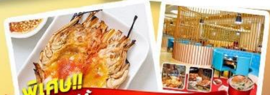
พิเศษ!! ก๊วยแม่น้ำ + HOTPOT SEAFOOD