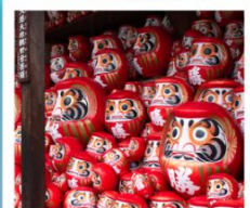
วัดคิตสึอิชิ