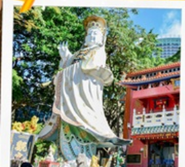
เจ้าแม่กวนอิมรพหลัสเบย์

23 กุมภาพันธ์ 2568 วันยืมเงินเจ้าแม่กวนอิม วัดสองอำเภอ