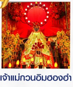
เจ้าแม่กวนอิมฮ่องกง

100% GUARANTEE 100% GUARANTEE การ์ตูนที่พักย่านช้อปปิ้ง โรงแรม Eaton Hotel และ iclub Mong Kok Hotel