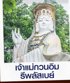
เจ้าแม่กวนอิม ริวลิสมีย์