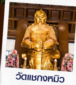
วัดเขangkหมิว