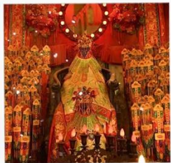
เจ้าแม่กวนอิมวัดสองอ่า