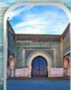
KASBAH OF MOULAY ISMAIL