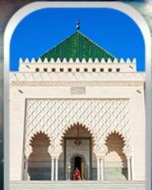
MOHAMMED V SQUARE