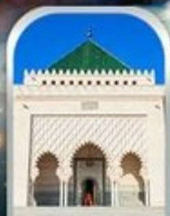
MOHAMMED V SQUARE