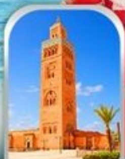
JEMAA EL-FNAA MARRAKESH