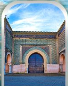
KASBAH OF MOULAY ISMAIL