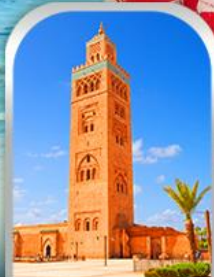
JEMAA EL-FNAA MARRAKESH