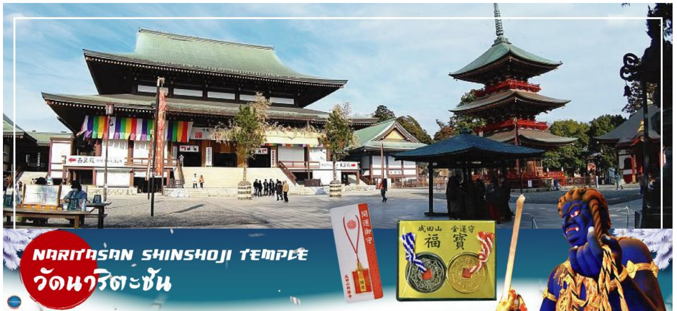
NARITASAN SHINSHOJI TEMPLE วัดนาริตะชิน

เมืองนาริตะ – วัดนาริตะชิน – ถนนปลาไหล โอโมเตะซังโตะ – ย่านโอโตะบะ – ห้างไดเวอร์ซิตี – ท่าอากาศยานนานาชาตินาริตะ