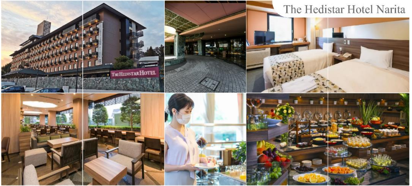
The Hedistar Hotel Narita

THE HEDISTAR HOTEL NARITA หรือระดับเดียวกัน