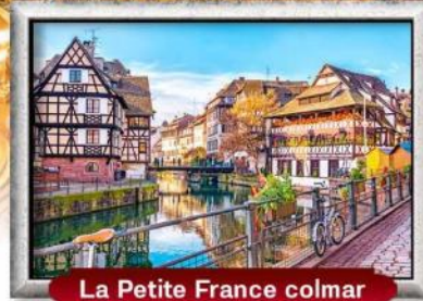
La Petite France colmar

บินหรู สายการบิน Full Service | พิเศษ! หอยแอสคาโก้