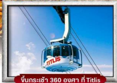
ขึ้นกระเช้า 360 องศา ที่ Titlis