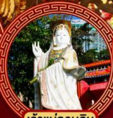
เจ้าแม่กวนอิม รีพัลส์เบย์