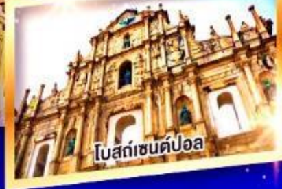
โบสถ์เซนต์ปอล

เมนูพิเศษ ห่านย่าง, ต้มชาฮ่องกง, บุฟเฟ่ต์สไตส์ฮ่องกง