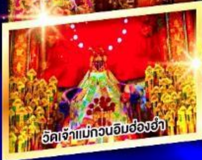
วัดเจ้าแม่กวนอิมฮ่องกง