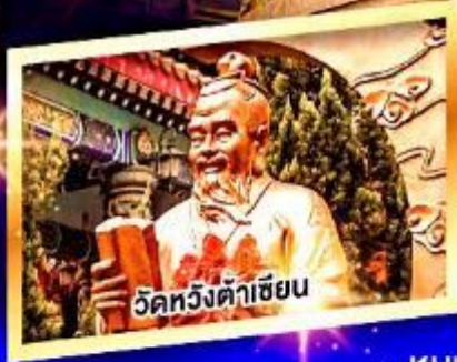
วัดหวังต้าเซียน