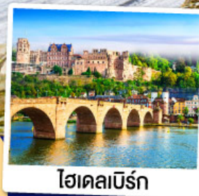
ไฮเดลเบิร์ก