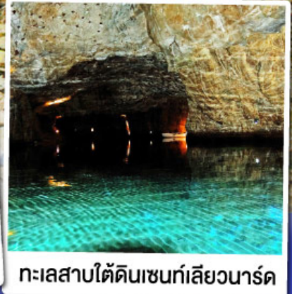
ทะเลสาบไ้ดินเซนที่เล็ยวาร์ด

ล่องเรือชมทะเลสาบไ้ดินเซนที่เล็ยวาร์ด ทะเลสาบไ้ดินลึกลับ สุดUnseenแห่งสวิตเซอร์แลนด์