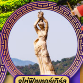
จูไห่พิงเซอร์เกิร์ล