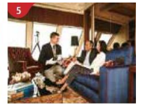
5 The Palace Indulge in European-style butler service and exclusive facilities.