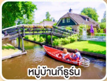
หมู่บ้านกังสุร์น