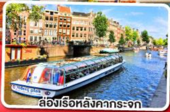
ล่องเรือหลังคากระจก