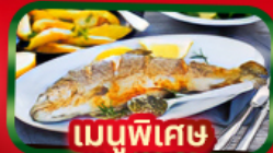
เมนูพิเศษ ปลาเทราต์ย่าง