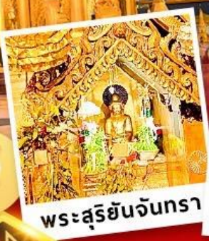
พระสุริยันจันทรา