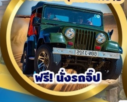
ฟรี! นั่งรถจี๊ป