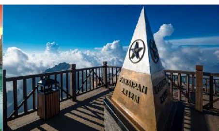
ยอดเขาฟานซิปัน