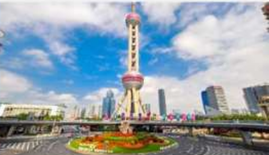
วงเวียนหมิงจู่