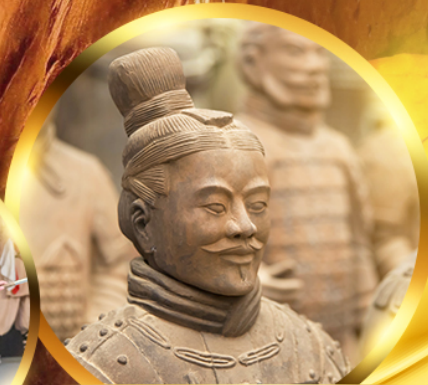
สุสานทหารจ้ินซี