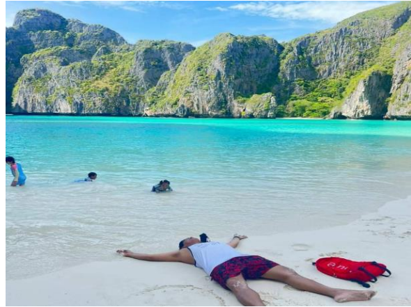
จากนั้นนำท่านไปชม อ่าวปิละ ถ่ายภาพกับความงามของลาгуน