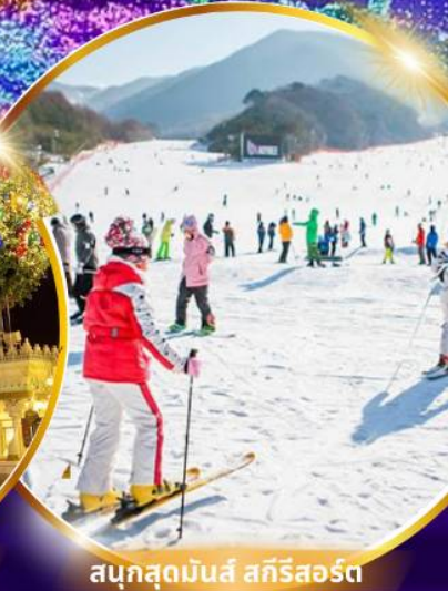
สนุกสุดมันส์ สกีรีสอร์ท

ชมจอ LED ขนาดยักษ์ที่รีสอร์ท 5 ดาว ใหญ่ที่สุดในเอเชียเหนือ สัมพัสมะสกีรีสอร์ท สนุกสุดมันส์ สวนสนุกเอเวอร์แลนด์ ชมพระราชวังคยองบกคุง ย้อนอดีตหมู่บ้านบุคซอน อันอก อิสระช้อปปิ้งคังนัม Lotte Duty Free