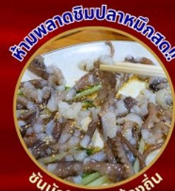
ห้ามพลาดชิมปลาหมึกสด!

โพฮังสเปซวอล์ก สกายวอร์ค ตามรอยซีรีส์ Hometown chachacha ถ่ายรูปชิคๆ หมู่บ้านวัฒนธรรมคิมซอน ขึ้นเคเบิลคาร์ ชมทะเลปูซาน นั่งรถไฟปุ๊กปิ๊ก sky capsule ชิมของอร่อยตลาดแฮუნแด อิสระช้อปปิ้ง Lotte Duty Free