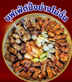
บุฟเฟ่ต์ปิ้งย่างไม่อั้น