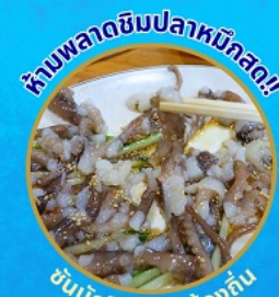
ห้ามพลาดชิมปลาหมึกสด!! ชั้นนักชี อาหารท้องถิ่น

โพฮังสเปซวอล์ก สกายวอร์ค ตามรอยซีรีส์ Hometown chachacha ถ่ายรูปชิคๆ หมู่บ้านวัฒนธรรมคัมซอน ขึ้นเคเบิลคาร์ ชมทะเลปูซาน นั่งรถไฟปูคปิก sky capsule ชิมของอร่อยตลาดแฮนแด อิสระช้อปปิ้ง Lotte Duty Free