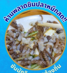
ซันนัคจิ อาหารท้องถิ่น

โปฮังสเปซวอล์ก สกายวอร์ค ตามรอยซีรีส์ Hometown chachacha ถ่ายรูปชิคๆ หมู่บ้านวัฒนธรรมคัมชอน ขึ้นเคเบิลคาร์ ชมทะเลปูซาน นั่งรถไฟปู๊กปิก sky capsule ชิมของอร่อยตลาดแฮอนแด อิสระช้อปปิ้ง Lotte Duty Free