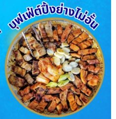
บุฟเฟ่ต์ปิ้งย่างไม่วัน