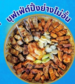
บุฟเฟต์ปิ้งย่างไม่อั้น