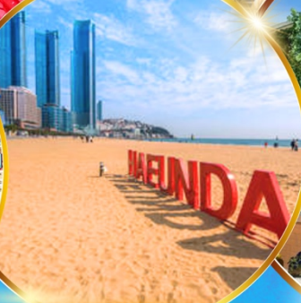
หาดแฮอนแด