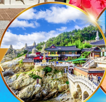
วัดแฮดยงกุงซา