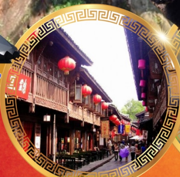
ถนนโบราณจีนหลี