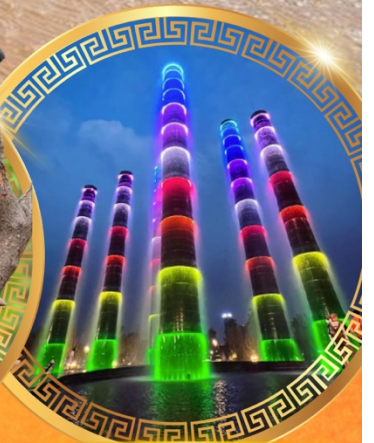
ชมการแสดงแสงสี