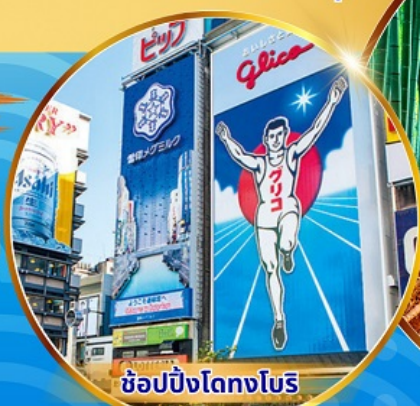
ซูปปิ้งโดทงโยริ