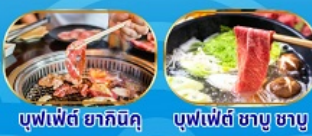
ซูฟเฟ็ตต์ ฮากินีคุ ซูฟเฟ็ตต์ ซาซุ ซาซุ

THAI สายการบินไทย บริการอาหารร้อน นน.กระเป๋า 23 กก. เอนเตอร์เทนเมนท์ฟรี