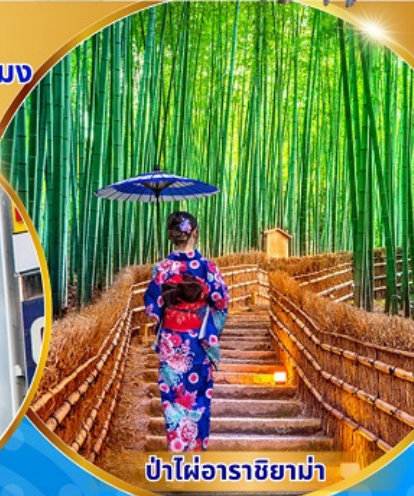
ป่าไฟอาราชิยาม่า

พักโรงแรม 3 ดาว ไม่เปลี่ยนโรงแรม ฟรี ประกันอุบัติเหตุ บริการอาหารท้องถิ่น