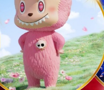
Pop Mart สงแด