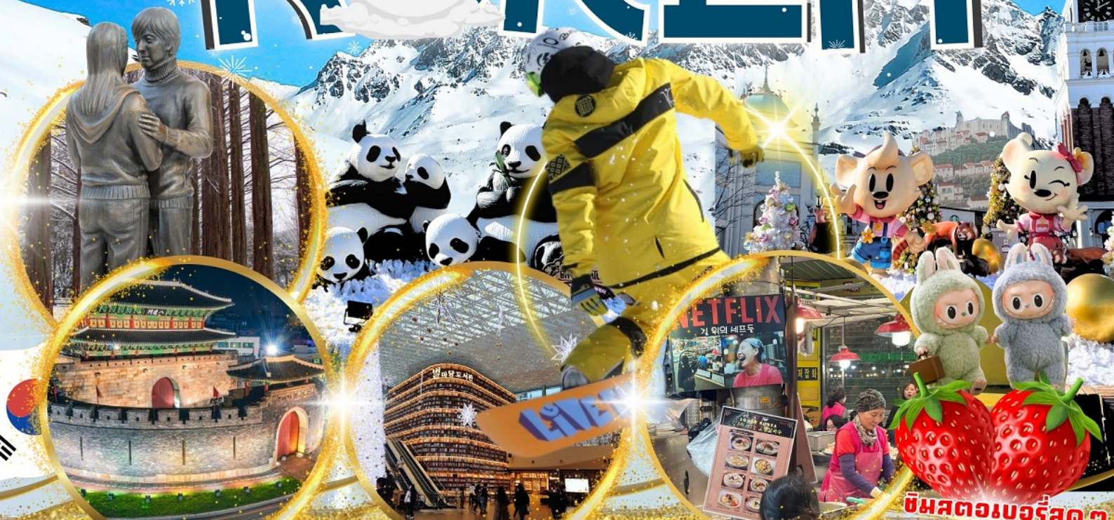
ป้อมฮวาซอง