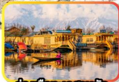
ล่องเรือทะเลสาบคัล