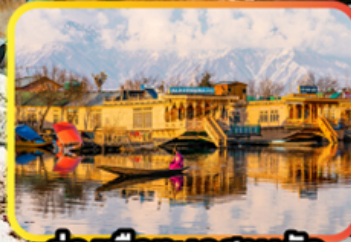
ล่องเรือทะเลสาบคิล