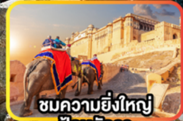
ชมความยิ่งใหญ่ ป้อมอัครา