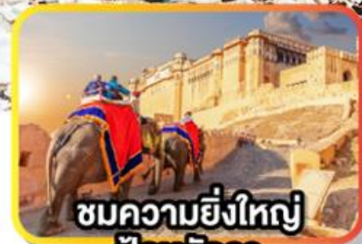
ชมความยิ่งใหญ่ ป้อมอัครา