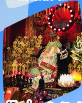
เจ้าแม่กวนอิมยิ้มเงิน