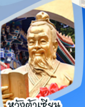
หลวงดำเซ็งน