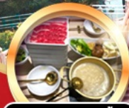
บุฟเฟ่ต์ชาบู เสิร์ฟไม่อั้น!!