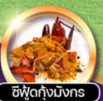
ซีฟู้ดกุ้งมังกร