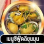
เมนูซีพีสุดเยี่ยม