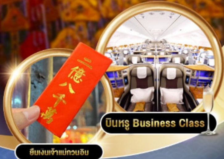
บินหรู Business Class