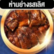
ทำอย่างรสเลิศ