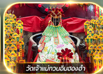
วัดเจ้าแม่กวนอิมสองอ้า