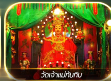
วัดเจ้าแม่กัมกิม