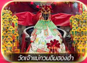
วัดเจ้าแม่กวนอิมฮองฮ่า