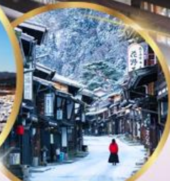
หมู่บ้านโบราณ นาราอิ จุกุ

ราคา เริ่มต้น 39,919 บาท รวมภาษีมูลค่าเพิ่ม 7%