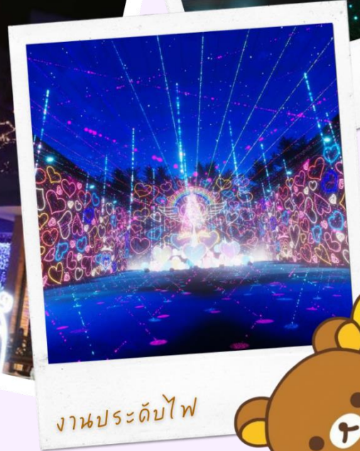
งานประดับไฟ