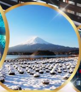
สวน ไออิชิ พาร์ค