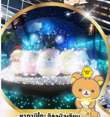
ซากามิโกะ อิลลูมินาเลี่ยน ธันมาร์ตุนสุดน่ารักจากค่าย SAN-X