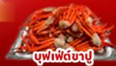
บุฟเฟ่ต์ซาชิมิ

พิกนากาโมะ 1 คืน พิกนากายามา 1 คืน พิกฟูจิ 1 คืน ออนเซ็น 2 คืน