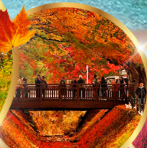
อุโมงค์เมเปิล