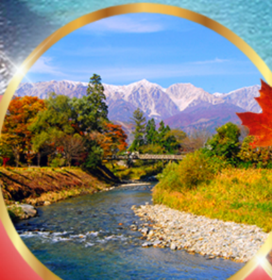
โออิตะ พาร์ค