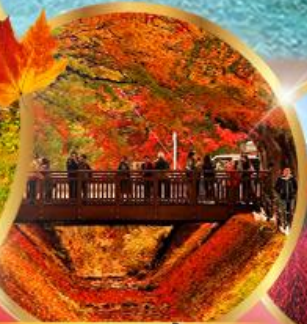
อุโมงค์เมเปิ้ล