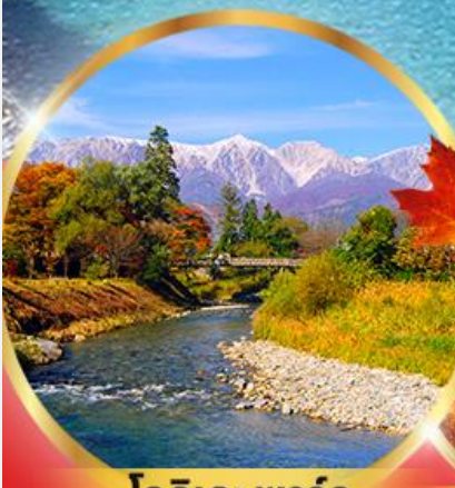
โออิเดะ พาร์ค