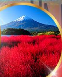
โออิชิ พาร์ค