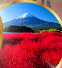
โออิชิ พาร์ค