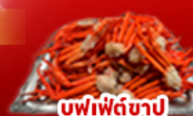
บุฟเฟ่ต์ขงปู

พักนททไม่1คืน พักททคยทมา1คืน พักฟูจิ1คืน ออนเซ็น 2 คืน